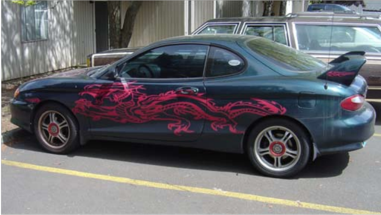
El coche de mi hermano

interacciones me pasan casi cada semana. Simplemente no puedo actuar como asiática.