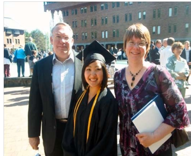
El día de mi graduación en la Western Washington University.