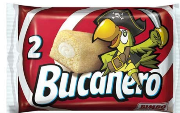
Arriba:: paquete de Twinkies. Debajo: paquete de una pieza de bollería similar que se comercializó en España con el nombre de Bucanero.