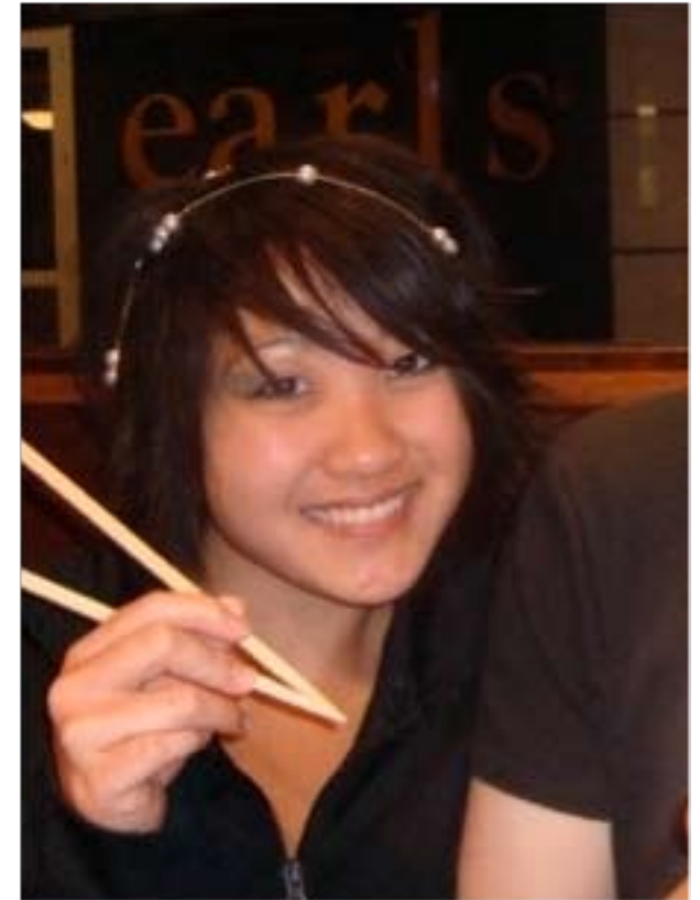
En un restarurante japonés (los palillos no son lo mío).

Conocí a una mujer coreana que, cuando supo que yo no hablaba corea-