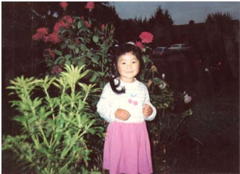
De niña, con mi cara redonda.

Como niña, no me veía a mí misma como asiática. No sabía qué era ser asiática. Tengo muchos recuerdos de cómo me di cuenta de que era diferente de la población blanca que me rodeaba. Recordar mi infancia da forma